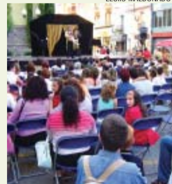
>> Espectacle infantil

El programa lúdic esportiu Montcada és Estiu finalitza amb xifres òptimes que parlen d'uns 15.000 participants en les activitats proposades per les Regidories d'Educació, Cultura, Joventut, Medi Ambient i Esports. Segons els seus responsables, gràcies a aquest cicle de propostes, els montcadencs han après a gaudir dels espais de la seva ciutat.