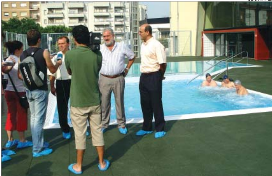
>> L'alcalde i el regidor d'Esports atenen els mitjans de comunicació en la roda de premsa inaugural

Ampliació. La nova piscina exterior complementa l'oferta d'aquest tipus d'equipaments al municipi. "La instal·lació és un nou espai de relació ciutadana i de convivència, que no pretén fer la competència a la piscina del centre" , va destacar Arrizabalaga. Els abonats de Montcada Aqua poden accedir a la piscina d'estiu de la mateixa manera que a la resta