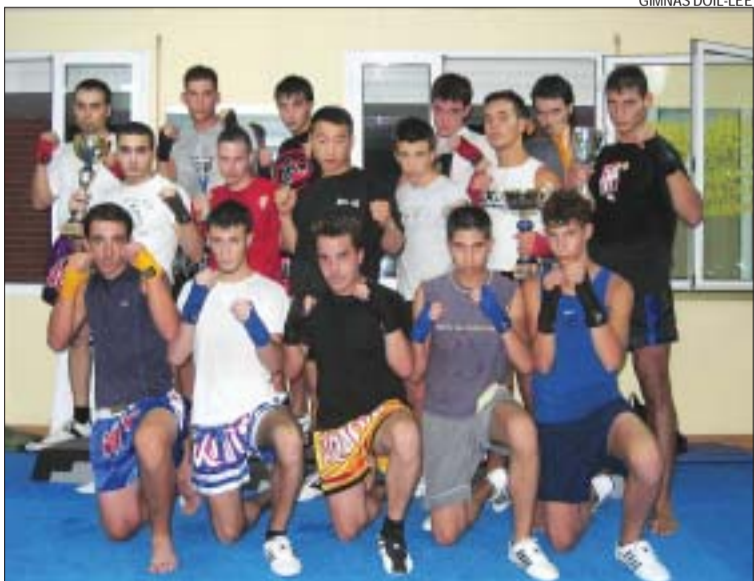
&gt;&gt; L'equip de kick boxing que va participar al torneig català